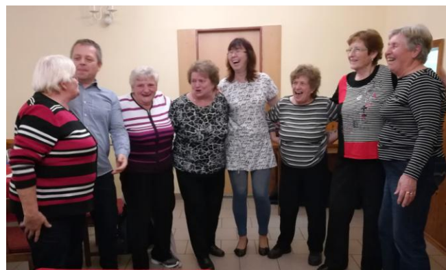
"Babovřesky" v akci.