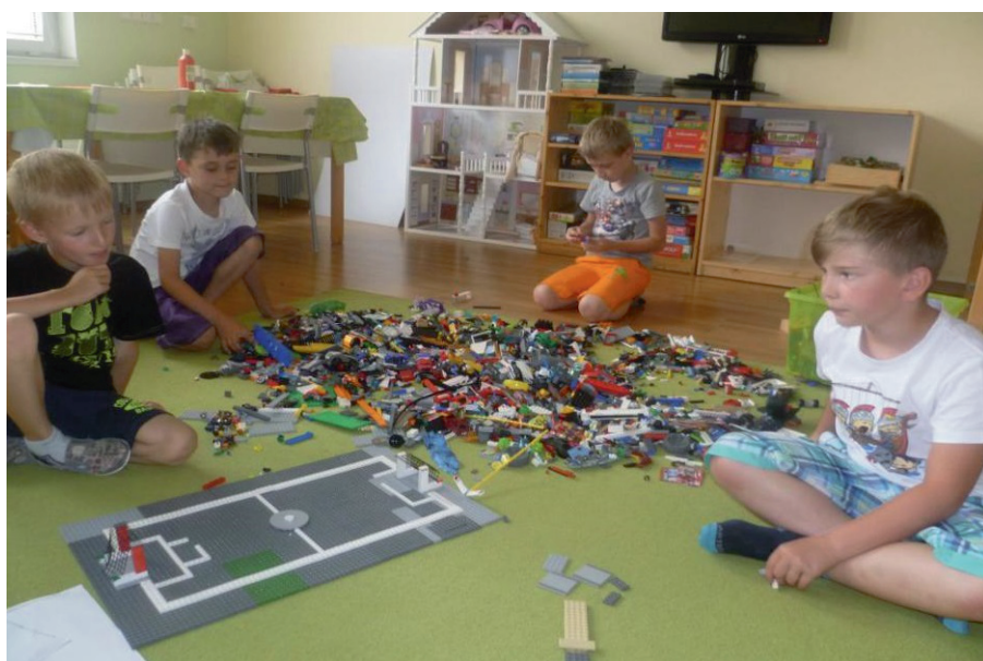
Zapojení školních dětí do plánování nového školního hřiště.