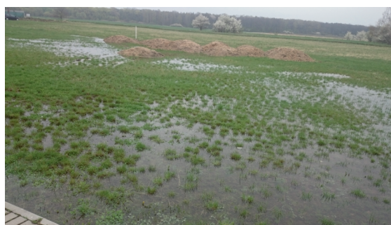
Zatopené dětské hřiště v severní.