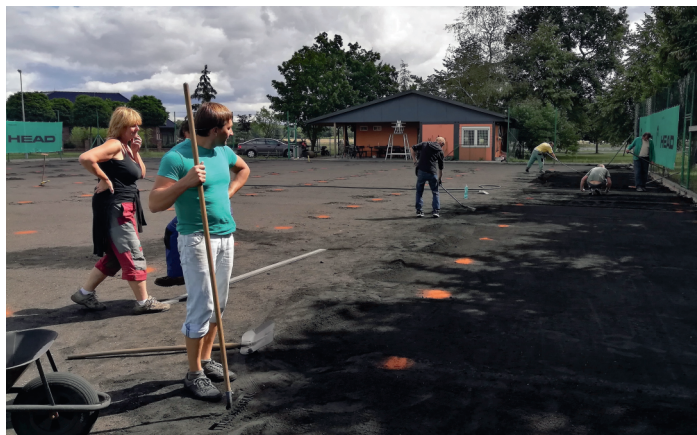
Pracovní četa v akci.