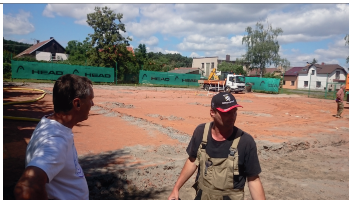
Odtěžení nepropustných vrstev tenisového hřiště.