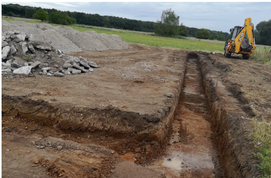
Dětské hřiště v severní v rekonstrukci - terénní úpravy.