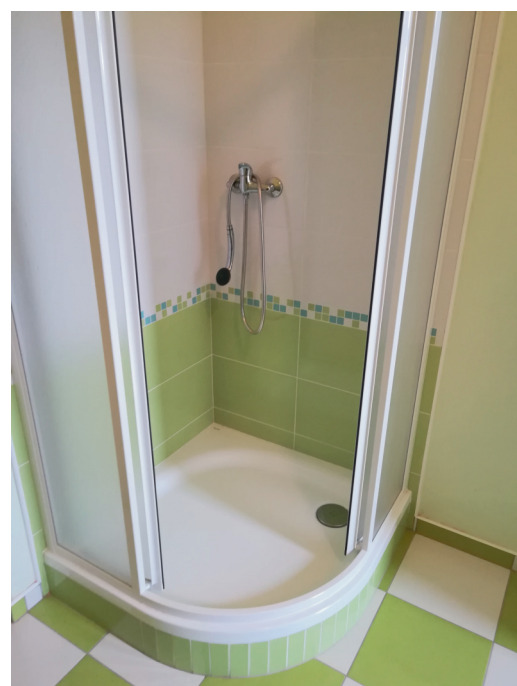
Sprchový kout na chlapeckých záchodech.