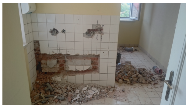
Toalety pro dívky v červenci.