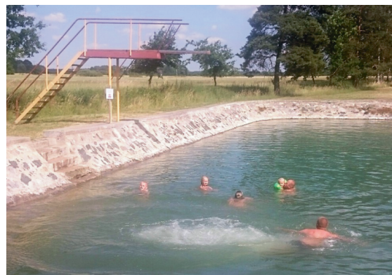
Letní koupání na koupališti.