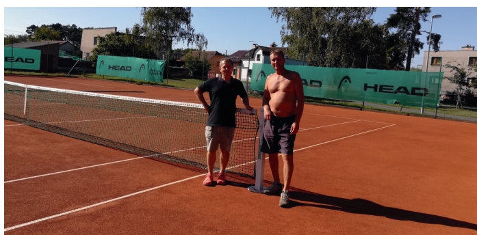
A dílo je hotové.