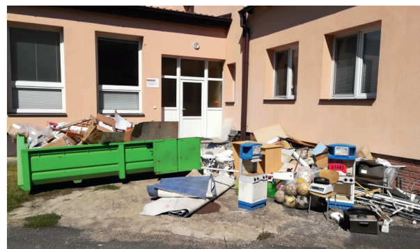
Prázdninový úklid ve škole.