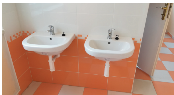
Toalety pro dívky v srpnu.