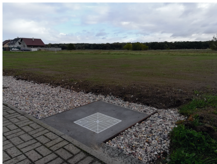
Opět zelená plocha budoucího dětského hřiště v Severní.

19. srpna uspořádali obyvatelé Severní ulice neformální seznamovací sousedskou párty. Konala se přímo na ulici a zábava končila až v časných ranních hodinách. Účelem bylo poznat se s vlastními sousedy, a to se povedlo. Severáci jsou v Sokolči spokojeni a s povděkem kvitují výstavbu nového hřiště, které hodlají využívat i pro další společenská setkání a události.